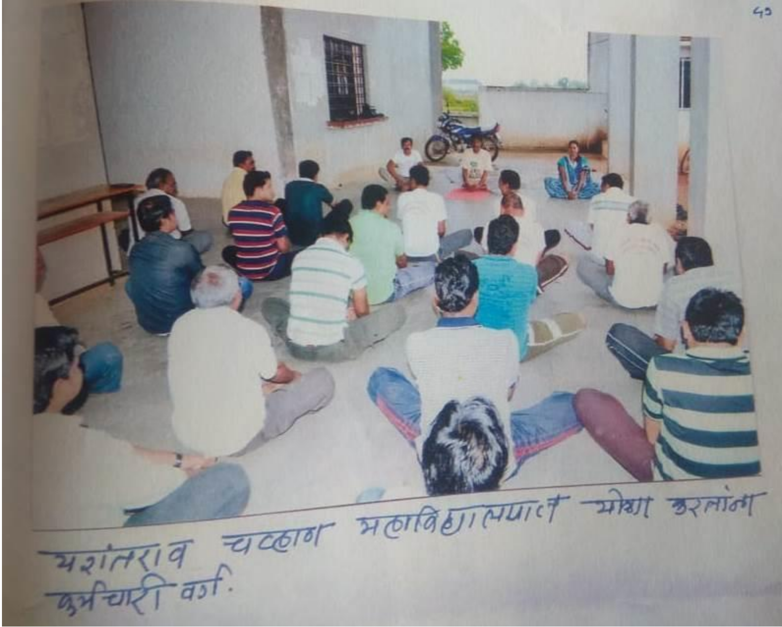
अशंकरराव चव्हाण महाविद्यालयात मोळा करलांम कुमचारी वग.