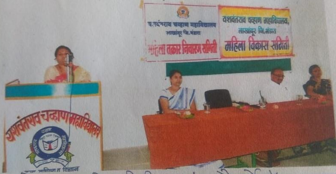
अध्यक्षेण जगन्नाथसंघी आगच्छिनि करंतांजा श्री. शुर्वे मैडम व्यवस्थापक, अहिल्या आर्थिक विकास महामंडळ, पंचायत समिती लख्यापूर