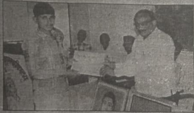
विद्यार्थ्यांना प्रमाणपत्र वितरीत करताना मान्यवर.

'वाढती लोकसंख्या एक भीषण समस्या' या विषयावर निबंध स्पर्धा घेण्यात आली. यात बी.कॉम, प्रथम वर्षाचा विद्यार्थी लाजेवार तसेच द्वितीय व तृतीय आलेला विद्यार्थ्यांना प्रोत्साहनपर 'प्रमाणपत्र' देण्यात आले.