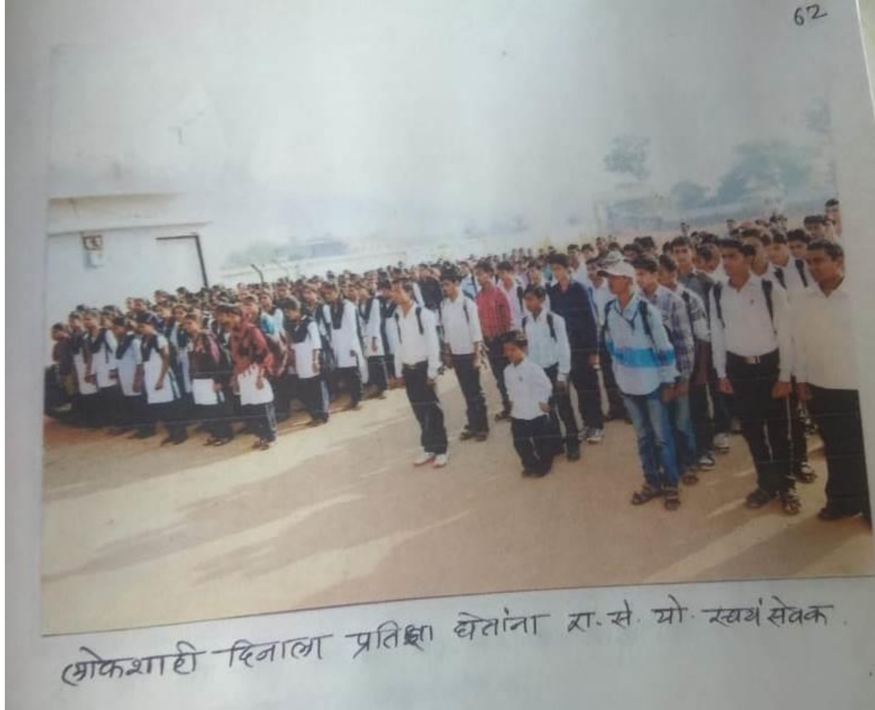
शोकशाही दिनालया प्रतिष्ठा घेताना रा.से.घो.स्वयंसेवक