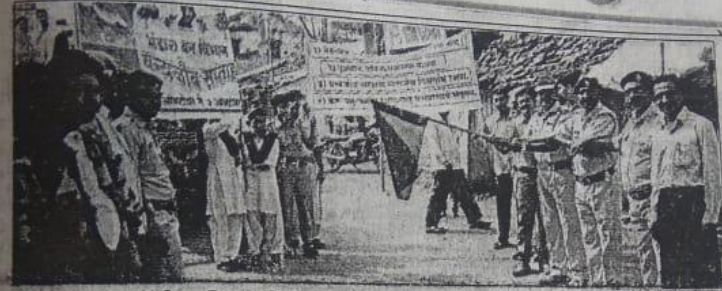
रॅलीला हिरवी झेंडी दाखविताना तहसीलदार व इतर अधिकारी