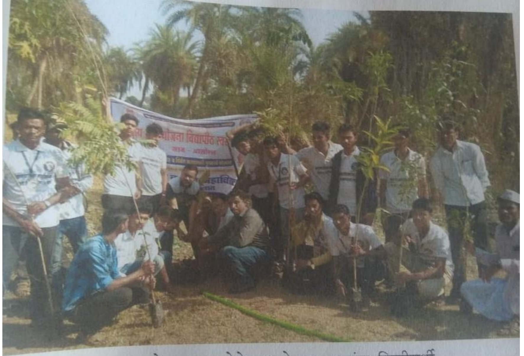
आसोला ग्राम येथे वृक्षारोपण करताना शिबीरार्थी